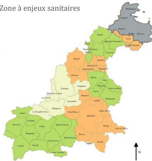
Zone à enjeux sanitaires

Conception : GP3A / Données : INSEE, OSM, IGN, GP3A Date : 18/08/2017