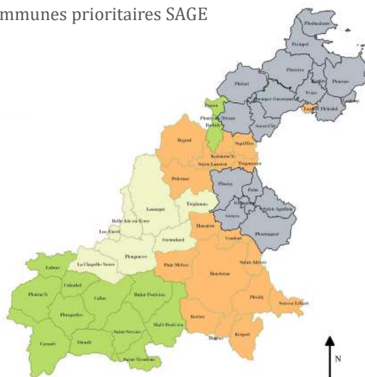
Communes prioritaires SAGE

Conception : GP3A / Données : INSEE, OSM, IGN, GP3A Date : 18/08/2017