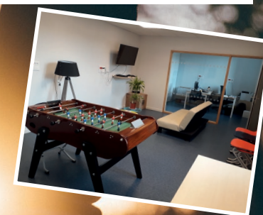
LE LOCAL JEUNES

>> ouvert aux 11-17 ans << ou déjà inscrits au collège