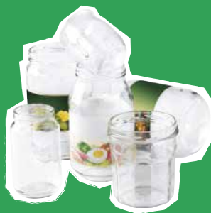
Pots et bocaux en verre (sans couvercle)