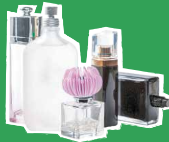
Flacons en verre