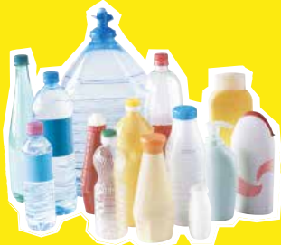
Bouteilles et flacons plastiques