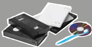
Petits objets en plastiques