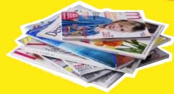
Tous les papiers