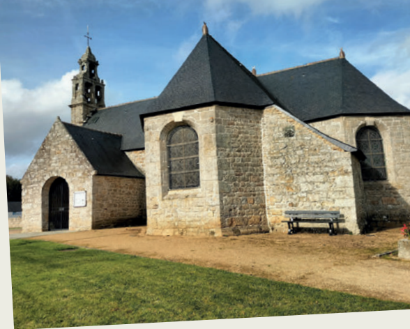
Église de Pabu