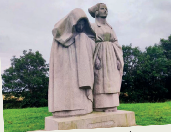
La statue des Veuves d'Islandais