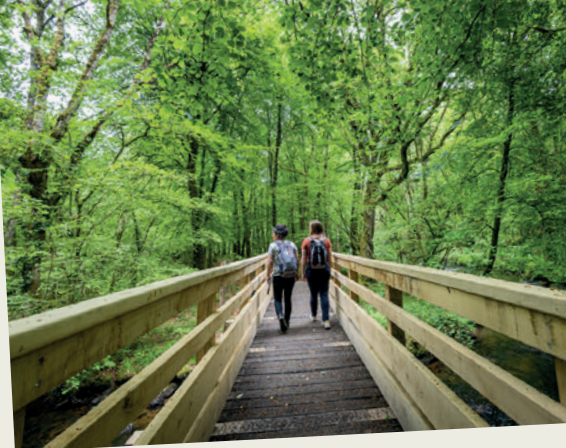
Forêt de Coat-an-Noz