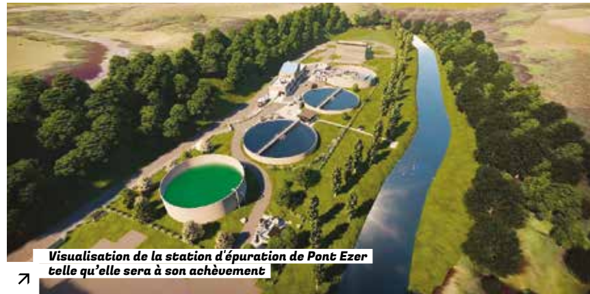
Visualisation de la station d'épuration de Pont Ezer telle qu'elle sera à son achèvement

Guingamp-Paimpol Agglomération modernise ses stations d'épuration pour garantir un traitement performant et durable des eaux usées.