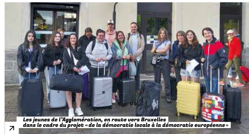
Les jeunes de l'Agglomération, en route vers Bruxelles dans le cadre du projet « de la démocratie locale à la démocratie européenne »

Ces actions s'inscrivent dans la Convention Territoriale Globale 2025-2029 signée avec la CAF qui fédère les partenaires autour d'un même objectif : permettre à chacune et à chacun de grandir et s'épanouir. ●