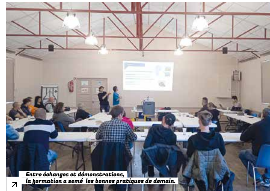
Entre échanges et démonstrations, la formation a semé les bonnes pratiques de demain.

Une trentaine de personnels communaux des espaces verts de Plourivo, Paimpol, Saint-Clet, Trégonneau, Bourbriac, Pontrieux et Ploumagoar ont participé à une formation dédiée à la réduction des déchets verts. L'objectif ? Adopter des pratiques plus vertueuses, comme la fauche tardive, le paillage ou le choix de végétaux adaptés, pour limiter les déchets et valoriser les ressources sur place. Cette action s'inscrit dans l'accompagnement des communes retenues dans le cadre d'un appel à manifestation d'intérêt. La visite de la plateforme de compostage de Pleumeur-Bodou a illustré les enjeux de cette gestion. ●