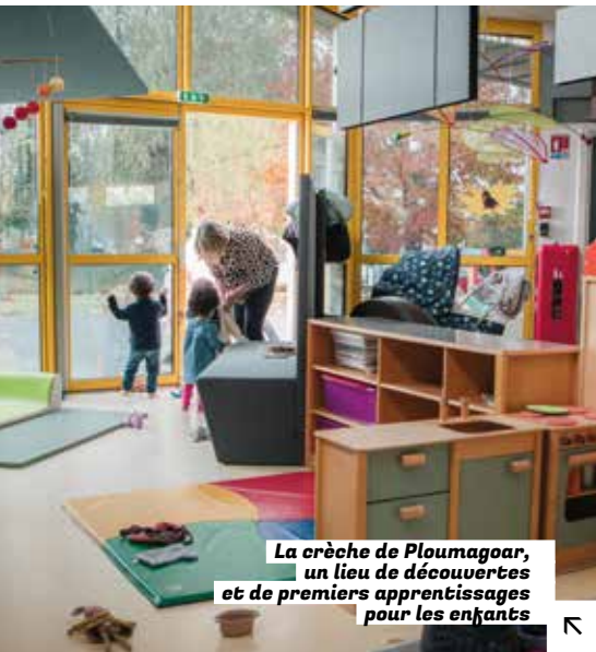
La crèche de Ploumagoar, un lieu de découvertes et de premiers apprentissages pour les enfants