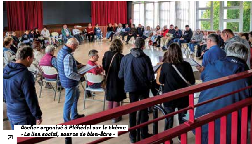
Atelier organisé à Pléhédel sur le thème « Le lien social, source de bien-être »

Du 6 au 19 octobre dernier a eu lieu la 36 e édition des Semaines d'Information sur la Santé Mentale. Cet événement, porté sur le territoire par le Contrat Local de Santé de Guingamp-Paimpol Agglomération et Leff Armor Communauté, est l'occasion de relever ensemble le défi de la santé mentale grâce à des ateliers, rencontres, débats, conférences, balades et moments conviviaux sur l'ensemble de l'agglomération. Cette année, la thématique « Pour notre santé mentale, réparons le lien social » a mis à l'honneur la manière dont chacun peut, à son niveau, se préserver tout en prenant soin des autres, par de simples gestes quotidiens et des moments d'échange. ●