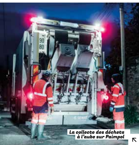
La collecte des déchets à l'aube sur Paimpol

Leur métier a beaucoup évolué ces dernières années avec deux objectifs : améliorer leurs conditions de travail et intégrer pleinement les enjeux environnementaux. Le développement de la méthode de pré-imprégnation illustre bien cette ambition. Particulièrement utilisée en milieu hospitalier, cette technique consiste à imbiber des lavettes avec la juste quantité d'eau et de produit avant le nettoyage. Résultat : une moindre consommation d'eau et de détergent, une meilleure hygiène des surfaces traitées et une réduction des efforts physiques comme des risques chimiques.