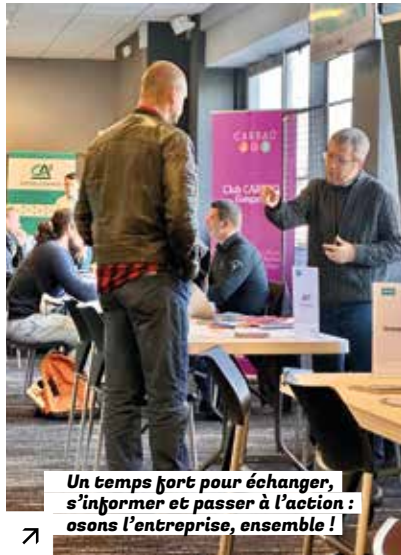
Un temps fort pour échanger, s'informer et passer à l'action : osons l'entreprise, ensemble !

Vous avez un projet, une idée ? Vous voulez créer ou reprendre une entreprise ? Guingamp-Paimpol Agglomération et ses partenaires sont là pour vous accompagner et vous donner les clés pour entreprendre et réussir, ici, sur le territoire.